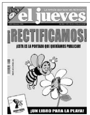
Capas de protesto publicadas, respectivamente, por El Jueves e Caduca Hoy